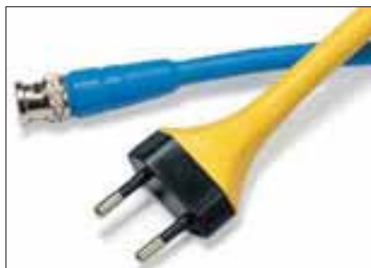
Med krympeforhold 3:1 kan TF31 benyttes i en rekke forskjellige applikasjoner.

TF21 har krympeforhold 2:1. Krympeslange type TF benyttes bl.a. til isolasjon og merking av kabler, gir god beskyttelse mot rust og fungerer godt som mekanisk beskyttelse og strekkavlastning.